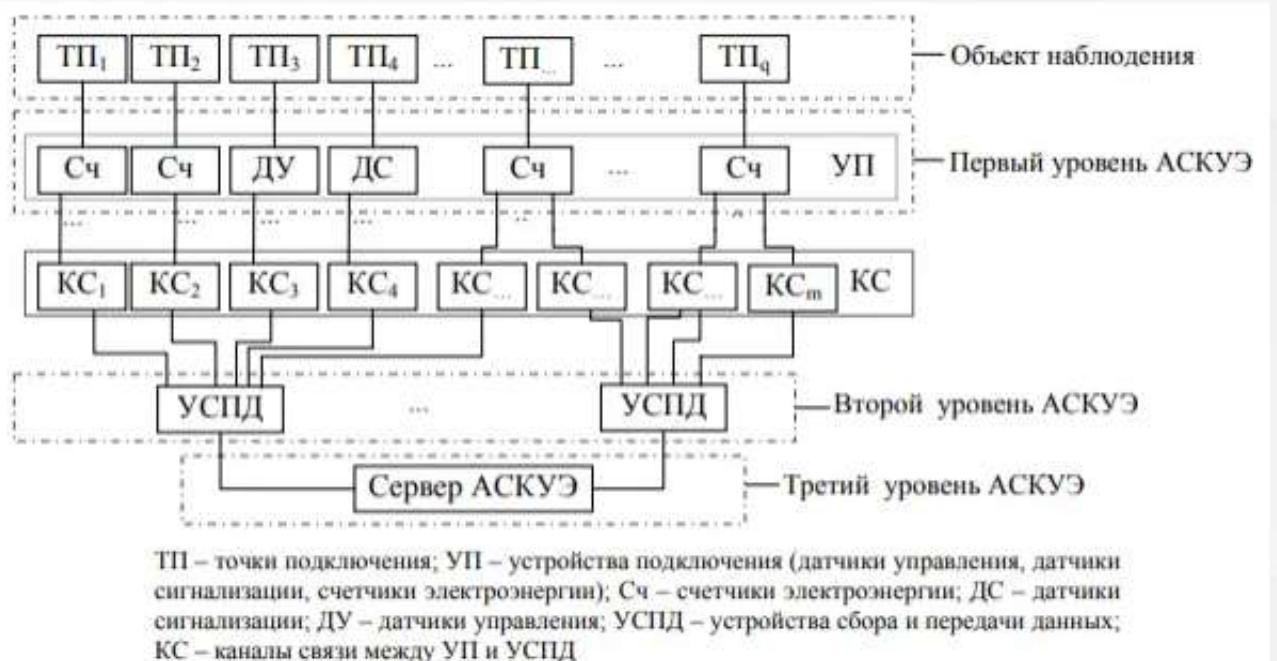
Рисунок 1 – Уровни АСКУЭ

10 Современные АСКУЭ состоят чаще всего из трех уровней (рисунок 1).